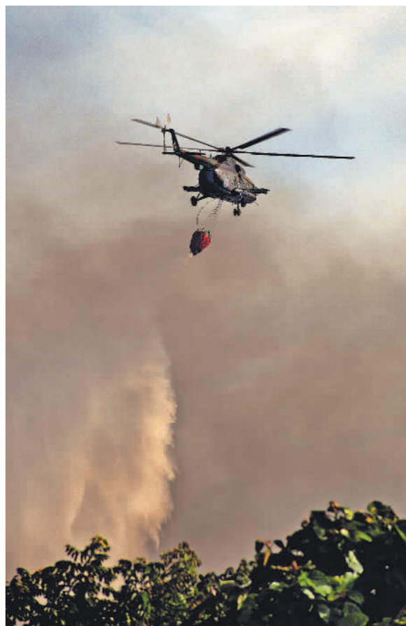
8月8日,在古巴马坦萨斯省,消防直升机在火灾现场作业。