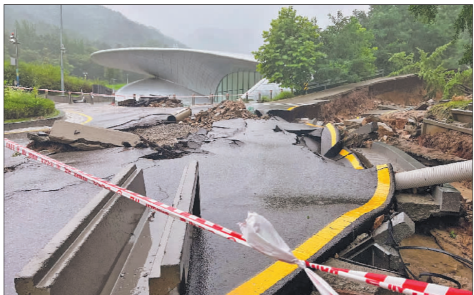
这是8月9日在韩国首尔大学拍摄的因遭遇强降雨而受损的道路(手机拍摄)。